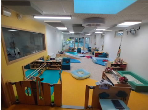
L'espace des bébés

À la crèche, on joue, on bouge, on apprend à vivre avec les autres à partir du moment où on en est capable, parfois on entend « non », mais c'est pour mieux avancer et grandir de façon harmonieuse.