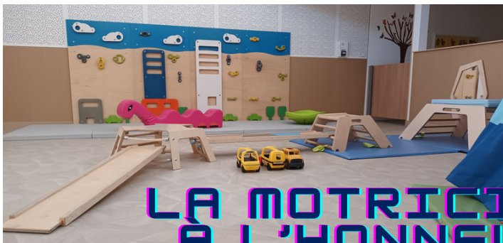
LA MOTRICITÉ À L'HONNEUR