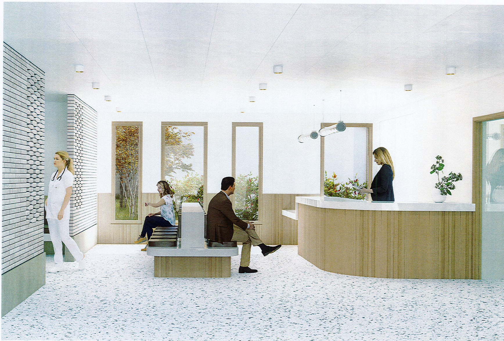
VUE DEPUIS LE HALL D'ACCUEIL DE LA MAISON DE SANTE