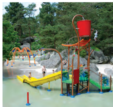
Base de loisirs de Buthiers.

Cet été, le service de la jeunesse de la Ville et le centre de loisirs Jacques-Yves-Cousteau proposent des mini-séjours en camping à l'intention des jeunes Ovillois. Les inscriptions se feront du 12 au 30 mai au service de la jeunesse. Deux destinations sont au programme :