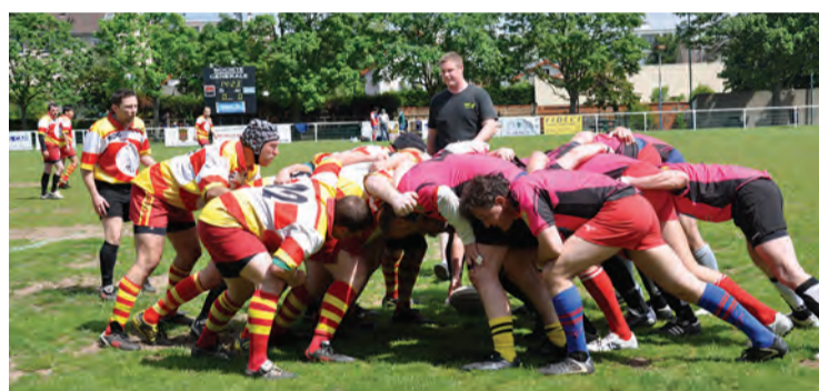
L'équipe des Zoz'Ovilleois en action au stade Robert-Barran.