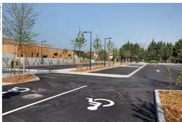
Le nouveau parking paysager a une capacité d'accueil de 50 places, en plus de 170 places situées à proximité.

Le parvis d'accueil de la piscine est accessible par une large rampe couverte d'un auvent, favorisant l'accès aux personnes à mobilité réduite. Ce quai en pente douce est