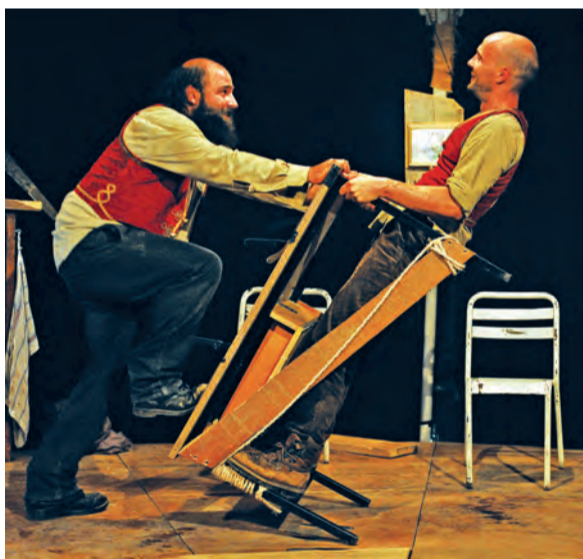
« Vu » et « Marée basse », deux spectacles de la Cie Sacékripa, qui conjuguent fantaisie, humour et performances.

Les jongleurs et acrobates de la compagnie Sacékripa sont accueillis, le 17 mai, à La Graineterie et dans le parc Charles-de-Gaulle. Deux lieux pour deux spectacles originaux et inventifs qui conjuguent fantaisie, humour et performances.