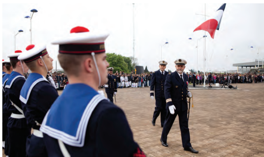
Tous les deux ans, le centre Commandant-Millé de la Marine nationale associe les plus jeunes à la commémoration de la victoire du 8 mai 1945.

représentants d'associations d'anciens combattants. Cette manifestation permettra d'associer les plus jeunes à ce devoir de mémoire et de rappeler que la liberté a triomphé grâce aux combats et aux sacrifices de leurs aînés. Ce sera aussi l'occasion de leur faire découvrir qui était le commandant Millé, l'histoire du centre avant et pendant la guerre et les événements qui s'y déroulèrent à l'approche de la libération de Houilles. Près de 600 écoliers, collégiens et lycéens, invités pour l'occasion, pourront également apprécier, dans le cadre du centenaire de la Première Guerre mondiale, une présentation de véhicules d'époque de sapeurs-pompiers et plusieurs expositions sur la guerre de 14-18. ■