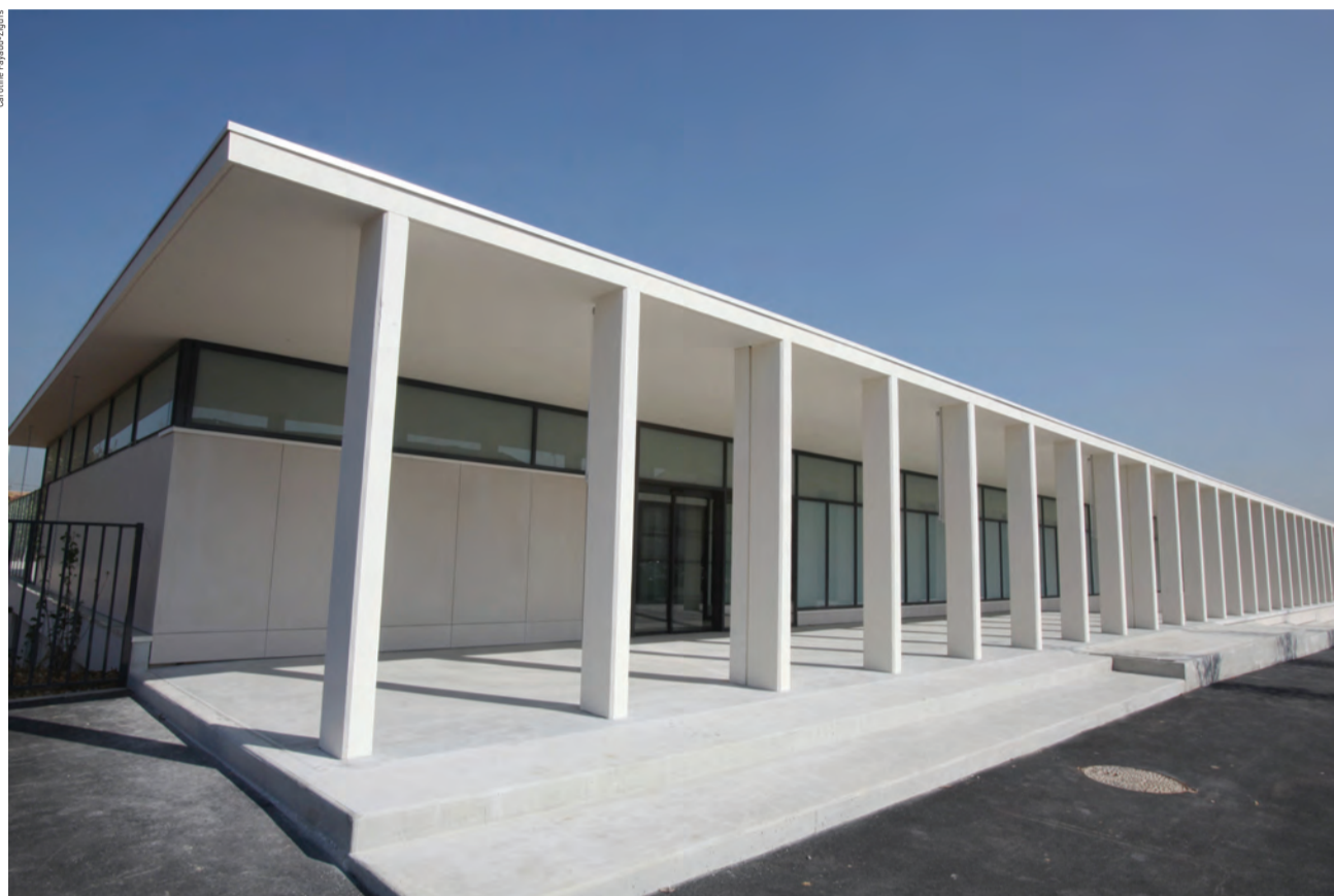
Parvis d'accueil de la piscine. Le bâtiment donne l'aspect d'une vitrine aquatique ancrée à quai sur la rue.

Le chantier de la nouvelle piscine d'intérêt communautaire de Houilles s'est achevé début mai. Deux journées portes ouvertes seront organisées, les 17 et 18 mai, pour permettre aux Ovillois de découvrir ce nouvel équipement situé dans le quartier du Réveil-Matin. Son ouverture au public est prévue le 19 mai. Visite des lieux en avant-première.