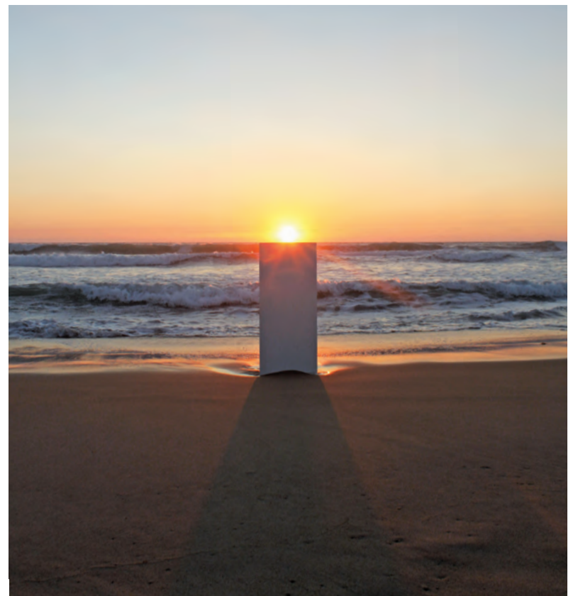
Endless Show, de Laurent Lacotte.

Exposition « Œuvres accessibles » : du 24 mai au 19 juillet. La Graineterie (27, rue Gabriel-Péri). Renseignements au 01 39 15 92 10. Réservation sur lagraineterie.ville-houilles.fr