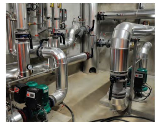
Le système de traitement de l'eau de la piscine utilise un procédé d'ultrafiltration pour le renouvellement quotidien de l'eau des bassins.