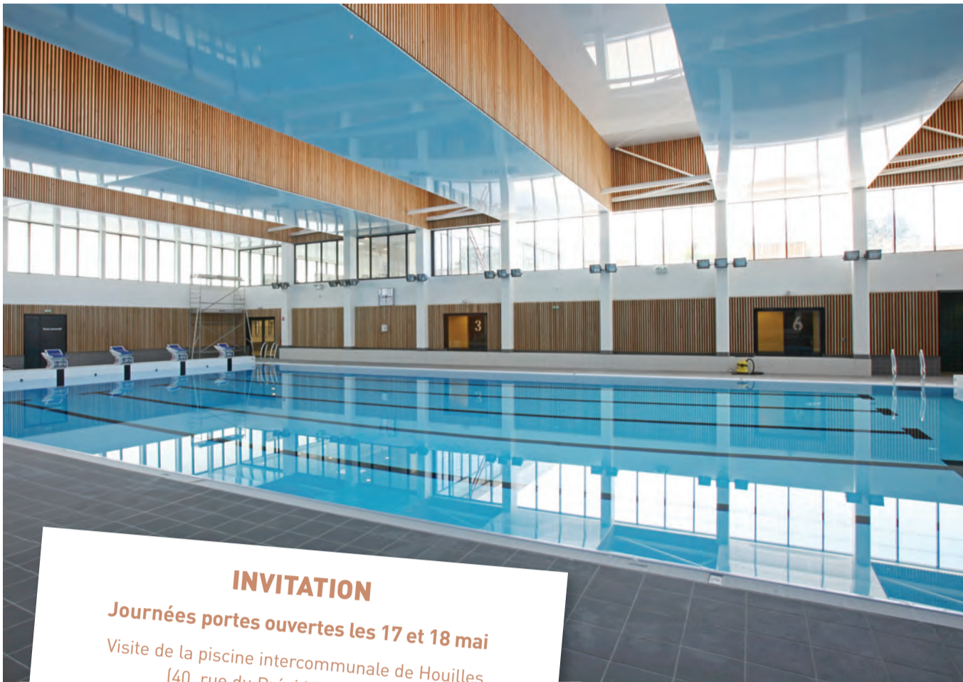
Le bassin sportif de 375 m 2 , d'une profondeur maximale de 3,50 m, est doté de 6 lignes d'eau de 25 m.