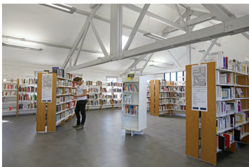
Un des espaces de la bibliothèque, récemment réaménagé.

Depuis septembre 2013, la bibliothèque Jules-Verne fait l'objet d'un vaste programme de rénovation : modification des espaces, aménagement des réseaux, mise en accessibilité. Pour permettre aux Ovillois de continuer à bénéficier des services de leur bibliothèque, la rénovation est réalisée étape par étape. L'aménagement du second étage s'est achevé en janvier dernier. Désormais, il permet d'accueillir les bureaux du personnel ainsi qu'une nouvelle salle polyvalente. Ce mois-ci s'achèvent les travaux