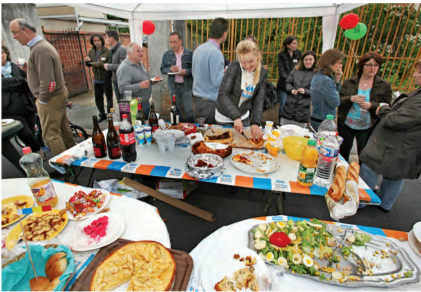
La Fête des voisins, un temps de partage et de convivialité qui suscite un véritable engouement à Houilles.

O n ne présente plus la Fête des voisins ! Manifestation incontournable pour les uns, « première » pour les autres, cet événement suscite, chaque année, un véritable engouement à Houilles. Cette nouvelle édition aura lieu le vendredi 23 mai, à partir de 19h. L'année dernière, ce temps de partage et de convivialité avait réuni plus de 5000 Ovillois toutes générations confondues autour d'un buffet, d'un pique-nique ou d'un barbecue sur près de 115 lieux de rendez-vous : cours, halls d'immeuble, placettes, jardins, coins de rue.