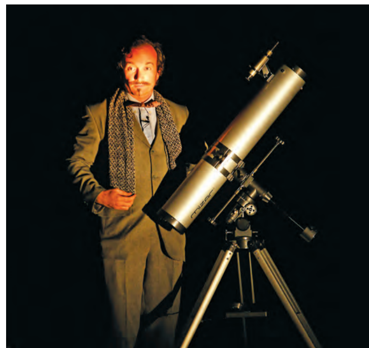
Le comédien Gwen Aduh livre un spectacle mêlant burlesque, paranormal et science de l'absurde.

Samedi 17 mai à 21h. Tarif : 3€. Durée : 1h15. À partir de 10 ans. La Graineterie (27, rue Gabriel-Péri). Réservation conseillée au 01 39 15 92 10 et sur lagraineterie.ville-houilles.fr