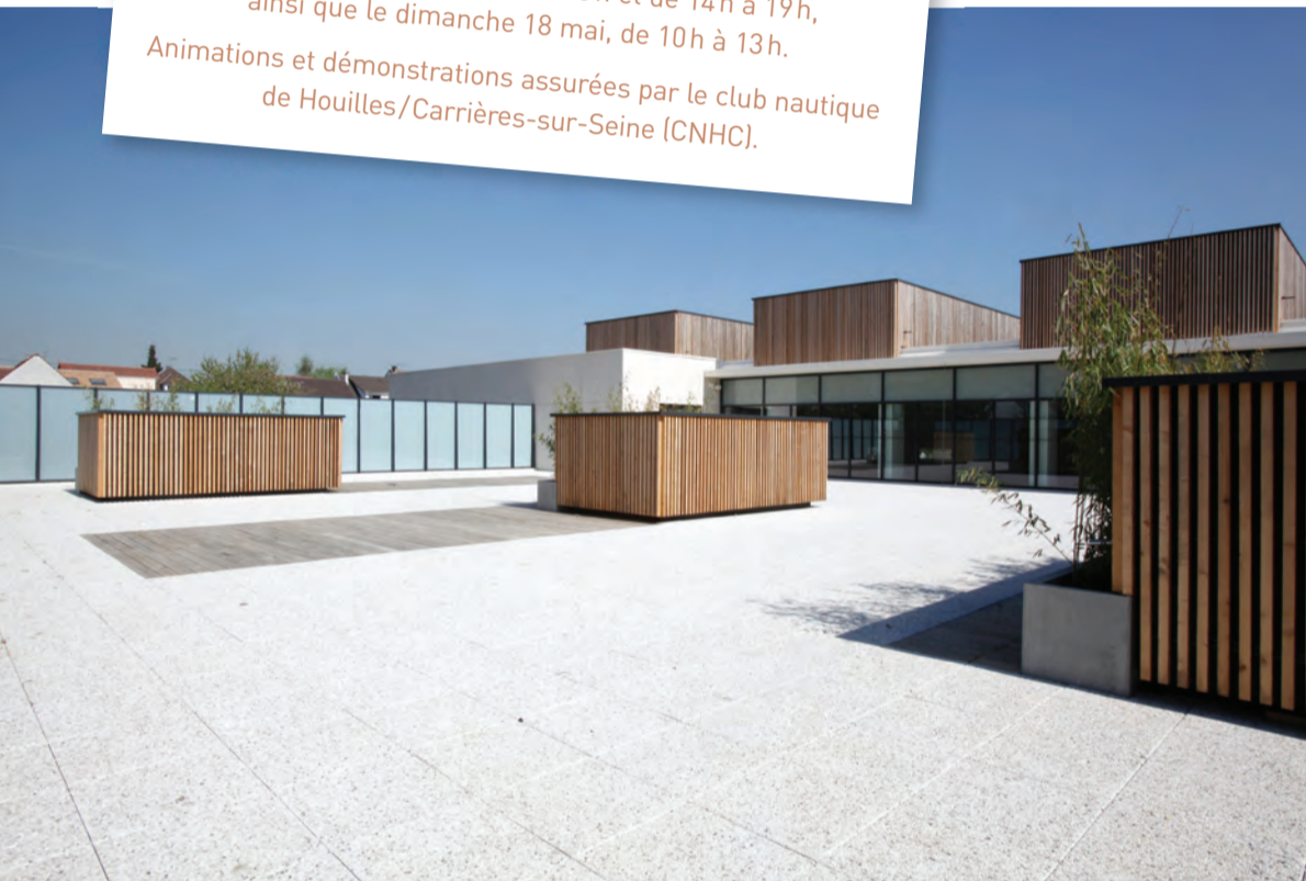
L'une des caractéristiques du bâtiment en bois, béton et verre est son architecture à la fois contemporaine et fonctionnelle. Ci-dessus : le solarium minéral de 600 m 2 .

Animations et démonstrations assurées par le club nautique de Houilles/Carrières-sur-Seine (CNHC).