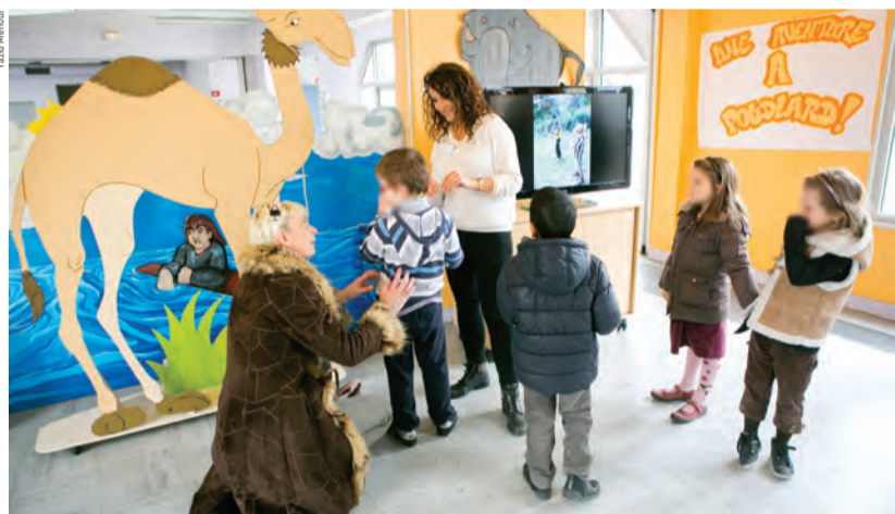
Journée portes ouvertes au centre Cousteau.

Le centre de loisirs Jacques-Yves-Cousteau organise, le samedi 17 mai, une journée « portes ouvertes ». L'occasion pour les parents de rencontrer l'équipe d'animation et de s'informer sur les activités qui y sont proposées. Le programme privilégie des activités artistiques, sportives et de découverte pour répondre aux attentes des enfants tout en favorisant la vie en collectivité.