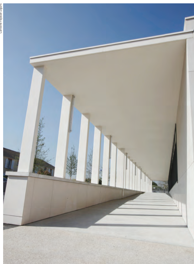
La rampe du hall d'entrée, conçue pour être accessible aux personnes à mobilité réduite, est directement reliée au parking.

L'une des caractéristiques du bâtiment en bois, béton et verre conçu par le cabinet BVL Architecture est son aspect à la fois contemporain et fonctionnel qui réussit une intégration équilibrée dans un quartier à dominante pavillonnaire. Édifiée sur trois niveaux, dont une partie est encastrée dans le terrain, la piscine donne l'aspect d'une vitrine aquatique ancrée à quai sur la rue. Le bâtiment répond aux impératifs actuels de développement durable, en termes de