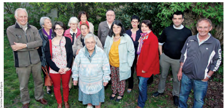
Les bénévoles de la conférence Saint-Vincent-de-Paul de Houilles-Carières agissent au quotidien en faveur des personnes isolées ou démunies.

Société Saint-Vincent-de-Paul (26, rue Blaise-Pascal). Tél. : 01 39 68 48 80.