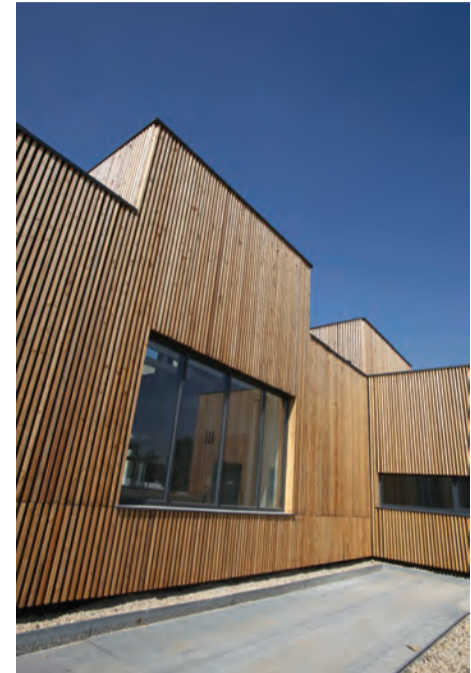
Petit bassin extérieur de décoration, qui sera alimenté par la pluie et servira à l'arrosage.