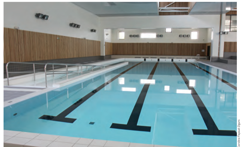
Le bassin d'apprentissage de 250 m 2 est consacré à la découverte et à la détente.