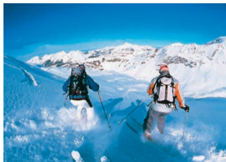
Le séjour d'hiver proposé par la Ville conjugue sport, jeux et découverte.

Dans le cadre des vacances de février, la Ville propose, du 2 au 9 mars, un séjour à la montagne pour les jeunes Ovillois de 7 à 17 ans. L'occasion pour eux de profiter, dans un milieu naturel préservé, de vacances d'hiver placées sous le signe du