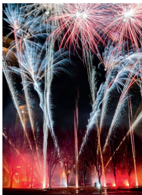
Feu d'artifice de clôture de la Corrida.