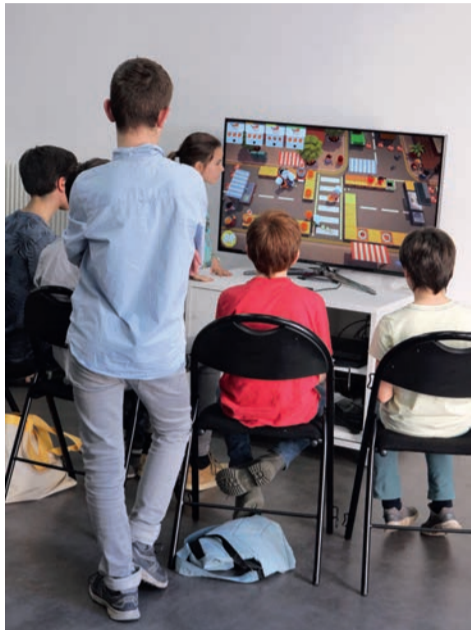
Atelier « jeux vidéo » à la médiathèque Jules-Verne.

« Jeux vidéo ». Les passionnés et simples curieux (à partir de 12 ans) sont invités à jouer sur les trois consoles (PS4, X Box One et Wii U)