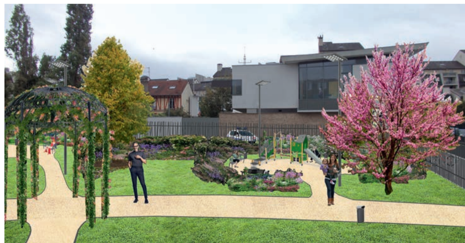
Perspective du futur square aux Moineaux, rue Hoche.