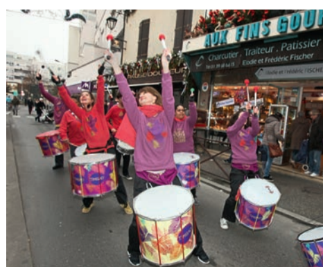
Les fanfares sur le parcours de la course.

> Inscriptions (15€ jusqu'au 25 décembre), en ligne sur www.corrida-houilles.fr et sur www.topchrono.biz . Bulletins d'inscription téléchargeables sur