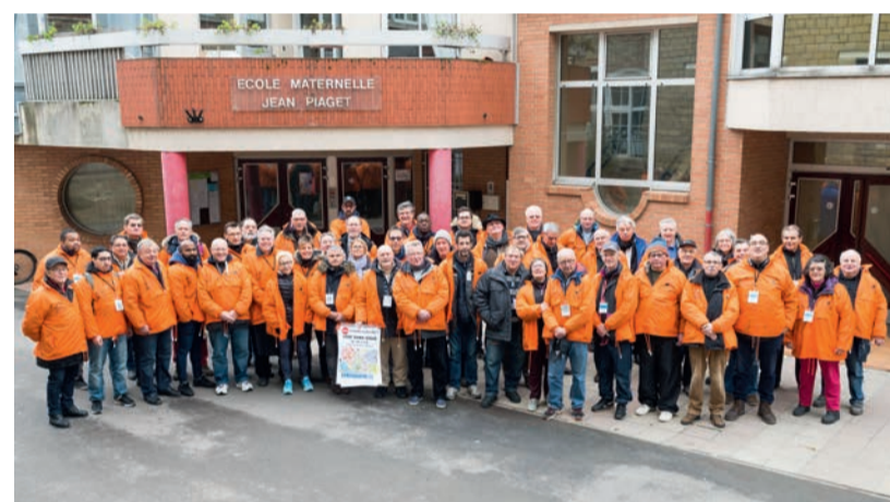
Les bénévoles oivilois assurent la parfaite organisation de la Corrida.

Athletics Federation (IAAF). L'autre épreuve, la Course populaire, ouverte à tous, licenciés ou non, fait partie des épreuves qualificatives du championnat de France. Très appréciée des spectateurs, elle contribue à la réussite festive de la manifestation, avec un grand nombre de coureurs déguisés pour l'occasion, rivalisant d'humour et d'originalité.