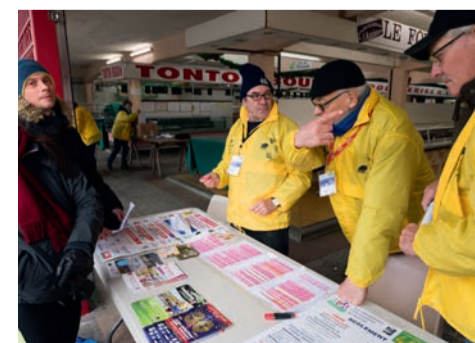
Remise des dossards aux coureurs.

> Retrait des dossards : devant la mairie, le samedi 29 décembre, de 10 h à 13 h, et le dimanche 30 décembre, de 12 h à 16 h.