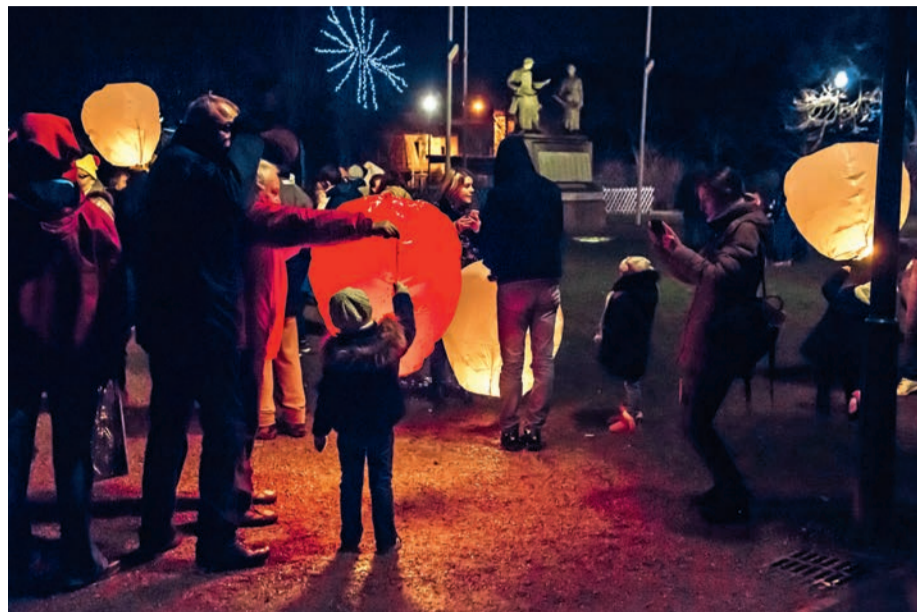
Lâcher de lanternes lumineuses, parc Charles-de-Gaulle, pour l'ouverture du Téléthon.

La 32 e édition du Téléthon aura lieu les 7 et 8 décembre prochains. Partout en France, des millions de Français répondront à ce grand élan national pour faire progresser la recherche sur les maladies génétiques, neuromusculaires et rares.