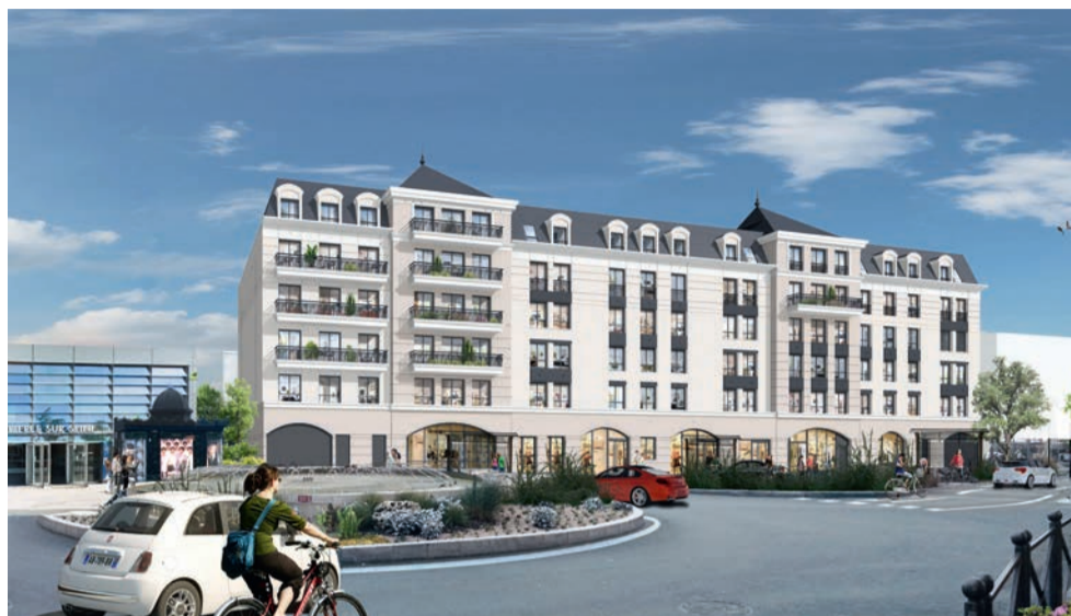
Vue d'architecte du futur programme immobilier du pôle gare, composé d'une résidence étudiante et d'une résidence sociale mixte.