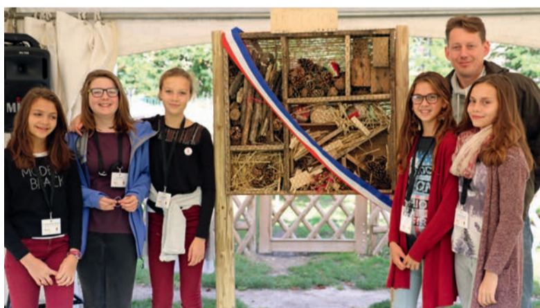
Les cinq élues du conseil municipal de jeunes à l'initiative du projet « Cœur écolo », accompagnées du référent citoyenneté du service de la jeunesse.

Elles sont cinq ! Cinq collégiennes du conseil municipal de jeunes (CMJ) déterminées, à travers leur projet « Cœur écolo », à sensibiliser les habitants au tri et au recyclage des déchets. La preuve par l'action ! En octobre dernier, elles ont créé avec tous les autres membres du CMJ la brigade verte de la braderie de Houilles. À leur actif : récupération d'objets et de textiles pour leur donner une seconde vie ; collecte de jouets au profit de l'association Emmaüs ; sensibilisation des exposants au tri de leurs déchets et à leur dépôt en fin de braderie dans des collecteurs. Auparavant, lors des Journées européennes du patrimoine (JEP), en sep-