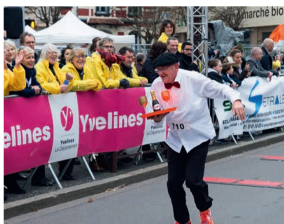
Les participants à la Course populaire rivalisent d'humour par leur déguisement.

La Course des As figure aujourd'hui dans le top 10 mondial des courses les plus prestigieuses de sa catégorie. Elle réunit l'élite internationale des coureurs de fond et de demi-fond, sur une distance de 10 km. Homologuée par la Fédération française d'athlétisme (FFA) et inscrite au calendrier national, elle est également détentrice du Road Race Label Argent décerné par l'International Association of