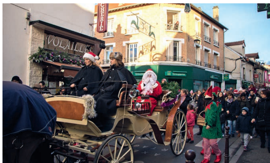
Parade du Père Noël dans les rues du centre-ville.

Marché de Noël des associations : samedi 15 décembre, de 11 h à 18 h, parc Charles-de-Gaulle. Parade du Père Noël : départ de la parade à 15 h 30, place de l'Abbé-Grégoire, devant la Graineterie.