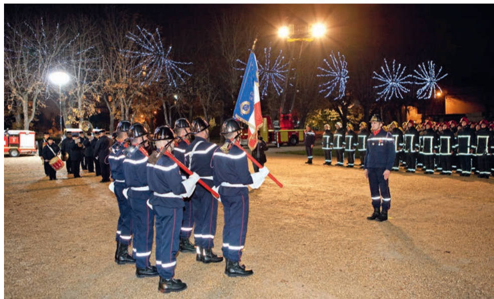
Cérémonie officielle à l'occasion de la fête de la Sainte-Barbe, parc Charles-de-Gaulle.

C'est une tradition chère aux sapeurs-pompiers : la célébration de leur protectrice, sainte Barbe. Cette année, la ville de Houilles a été choisie au niveau départemental pour accueillir, le 4 décembre, cette traditionnelle cérémonie organisée par les sapeurs-pompiers des Yvelines. L'occasion pour le public d'assister, parc Charles-de-Gaulle, à une revue d'un détachement du service dépar-