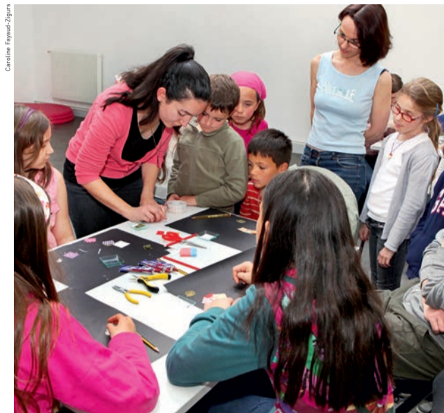
Atelier « L'heure créative » proposé par la médiathèque Jules-Verne.

Samedi 16 février, toute la journée à partir de 10 h (accès libre).