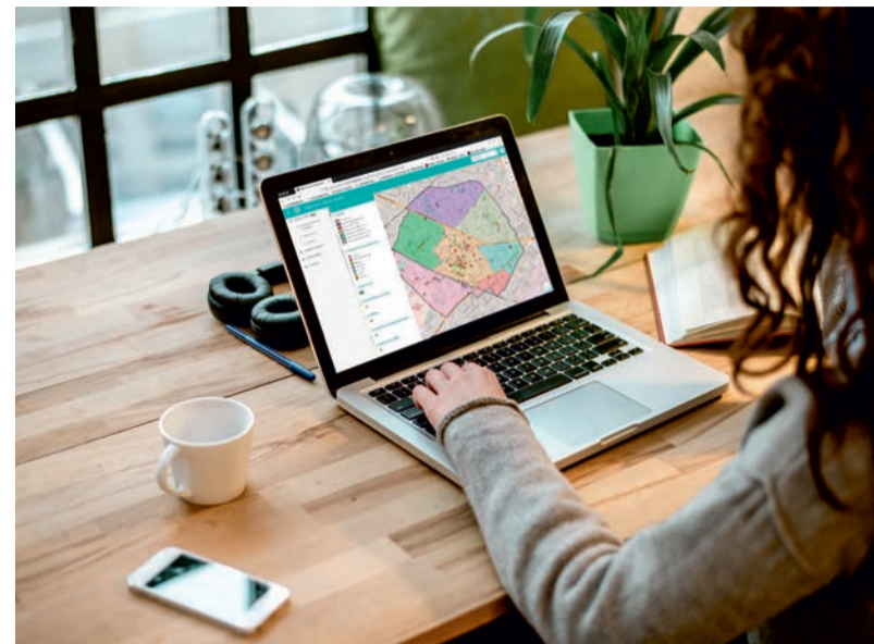
Le plan interactif de Houilles répertorie tous les espaces publics et permet d'effectuer des recherches par adresses et par rubriques.