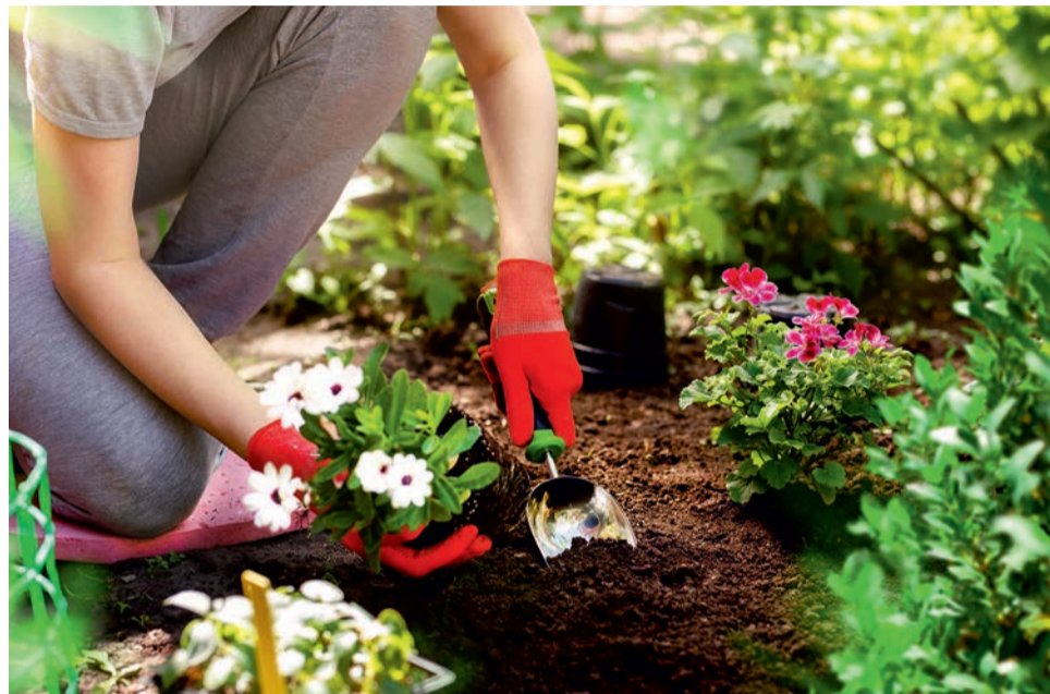
Depuis le 1 er janvier 2019, l'utilisation des pesticides est interdite pour jardiner ou désherber.

La réglementation concernant l'utilisation des pesticides chimiques* évolue, afin de protéger votre santé et l'environnement. Depuis le 1 er janvier 2019, les particuliers ne peuvent plus acheter, utiliser et stocker des pesticides chimiques pour jardiner ou désherber. Pour jardiner autrement, les alternatives non chimiques et les produits de bio-contrôle sont des solutions efficaces pour prévenir et si besoin traiter. L'ensemble des conseils et solutions pour jardiner sans pesticides est disponible sur le site