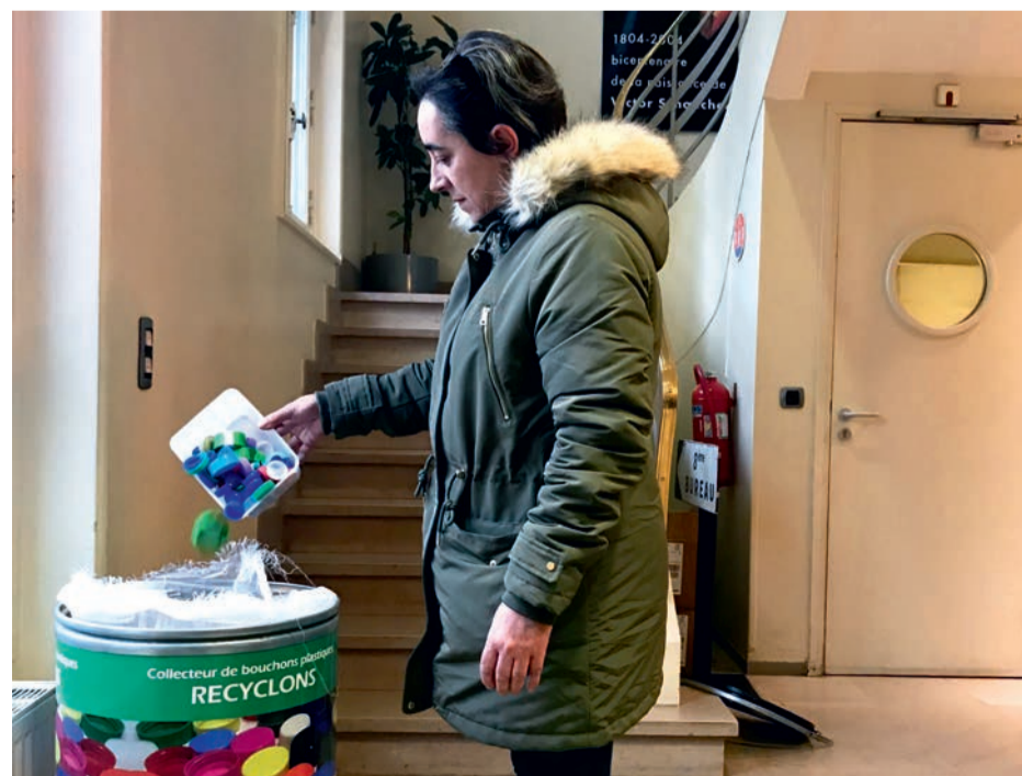
L'accueil de l'hôtel de ville est un des points de collecte de l'opération « Roulez petits bouchons ».

Association Handi-Cap-Prévention (3, allée Beethoven, Chatou). www.handicaprevention.com