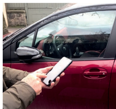
Le paiement des forfaits de stationnement Résident peut se faire via l'application Parknow.

tée : semaine, mois, trimestre, année. Les forfaits Résident sont accordés aux Ovillois habitant dans une zone de stationnement payant, ne disposant pas d'une place de stationnement sur leur lieu de domicile et ne pouvant en créer une (à raison d'un forfait par foyer). Le renouvellement ou la souscription à cet abonnement délivré pour une année civile se font en transmettant les documents nécessaires au Point Indigo ou via https://houilles.e-habitants.com . ■