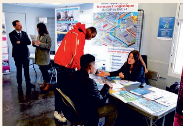
Rendez-vous au Ginkgo pour le forum de l'alternance, le 13 février, de 14 h à 17 h 30.

L'alternance combine période de formation et expérience en entreprise. Une formule qui attire de plus en plus de jeunes. Afin d'informer le jeune public (collégiens, lycéens, étudiants jusqu'à bac+5) sur ce dispositif, véritable passerelle vers l'emploi et l'insertion professionnelle, un forum de l'alternance est organisé au Ginkgo, le 13 février. Ce forum, réservé aux classes des collèges durant la matinée et ouvert à tous durant l'après-midi, permettra d'orienter les jeunes dans leurs choix, de les renseigner sur les différents types de contrats d'alternance existants (apprentissage ou professionnalisation) et de leur donner des outils pour mieux aborder le monde du travail et de l'entreprise. Pour répondre à toutes les questions que se pose le jeune public, de nombreux partenaires seront présents : centres de formation d'apprentis (CFA), centres d'information et d'orientation (CIO) de collège et de lycée, mission locale intercommunale de Sartrouville, Yvelines information jeunesse (YIJ), chambre de commerce et d'industrie (CCI) d'Île-de-France... En complément, les jeunes visiteurs pourront