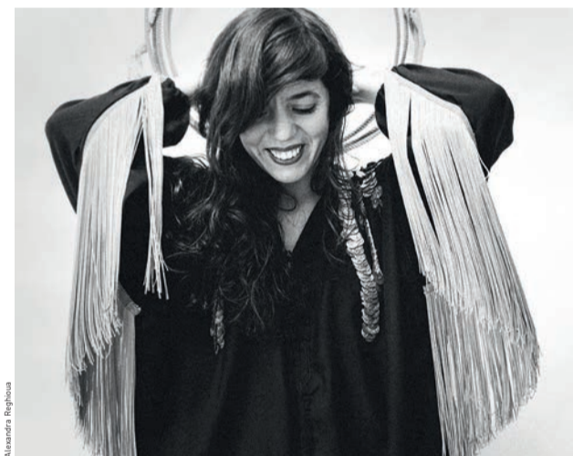
Concert-rencontre avec la chanteuse Yelli Yelli dont l'univers sensible mêle folk et musique kabyle.