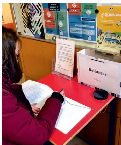
Accueil de la mairie : les Ovillois peuvent s'exprimer sur le cahier de doléances mis à leur disposition.

À l'initiative du président de la République, le gouvernement a engagé un grand débat national permettant à toutes et à tous de débattre de questions essentielles pour les Français. À vos côtés au quotidien, la municipalité a souhaité vous permettre de vous exprimer dans ce cadre. Ainsi, elle a mis à votre disposition un « cahier de doléances » à l'accueil de la mairie ainsi que sur le site Internet de la Ville, où chaque citoyen peut inscrire ses suggestions autour des questions du pouvoir d'achat, de la fiscalité, de la démocratie et de l'environnement. Par ailleurs, les Ovillois sont conviés à une réunion publique d'échanges libres et impartiaux, le samedi 9 février, à 9h30, salle Cassin (1, rue Jean-Mermoz). ■