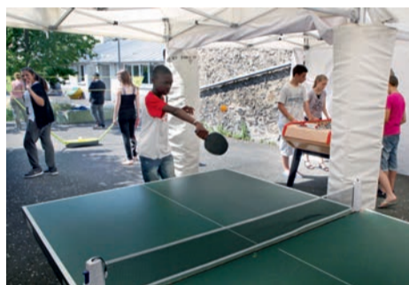
Animations à la carte.

Le Ginkgo (7-9, boulevard Jean-Jaurès). Accueil : lundi, mercredi, jeudi et vendredi, de 9 h à 12 h et de 13 h 30 à 18 h ; mardi, de 9 h à 10 h 30 et de 13 h 30 à 18 h. Renseignements au 01 61 04 42 60 et sur jeunesse.ville-houilles.fr