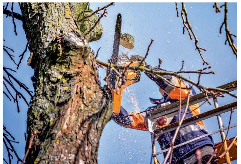
En février, la Ville procède à la taille des arbres de la commune.

bustes et des arbres. Ce tapis végétal, réparti sur un sol préalablement désherbé et aéré, possède de multiples vertus. Il bloque la germination et la croissance des mauvaises herbes, évite le dessèchement de la terre en été, protège le sol de l'érosion et favorise une bonne croissance des végétaux en limitant les écarts thermiques du sol. Une fois dégradé, le paillis est incorporé au sol et permet de l'enrichir en éléments nutritifs. ■