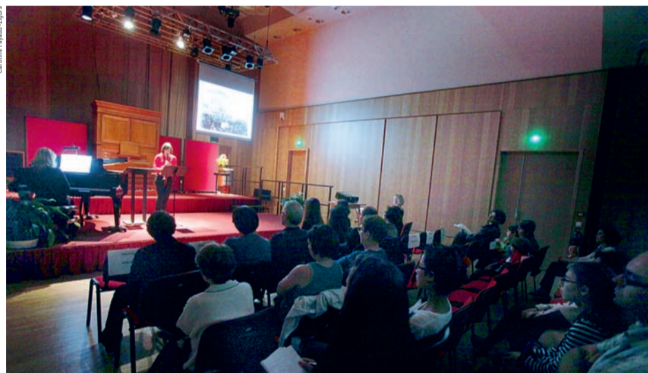
Auditions publiques d'élèves du conservatoire.

Des auditions d'élèves du conservatoire permettent aux jeunes musiciens de jouer en situation, devant un public.