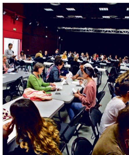
Baby-sitting dating, salle Cassin.

Houilles information jeunesse, Le Ginkgo (7-9, boulevard Jean-Jaurès). Tél. : 01 61 04 42 63. Accueil : lundi, mardi, mercredi et vendredi, de 14 h à 18 h (fermeture hebdomadaire le jeudi).