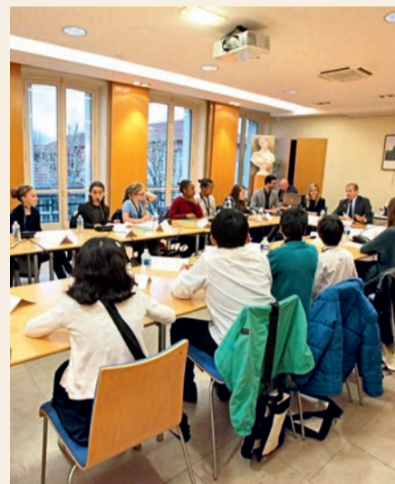
Séance plénière du CMJ à l'hôtel de ville.

Le 15 février, les élèves des trois collèges de la ville (Lamartine, Guy-de-Maupassant, Sainte-Thérèse) éliront leurs représentants au sein du conseil municipal de jeunes (CMJ) de la Ville. Une école de démocratie, de prise de parole et de décision, et une expérience unique de l'action municipale : le CMJ de Houilles est tout cela à la fois. Depuis sa création, en 1996, le CMJ a permis à de très nombreux projets