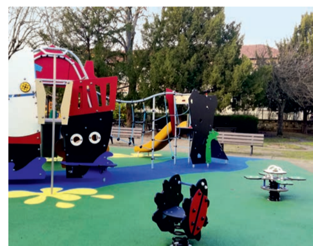
Renouvellement des structures de jeux du square du parc Charles-de-Gaulle.

L'entretien régulier de l'ensemble des aires de jeux est assuré par le service de l'environnement. Au total ce sont 108 structures, réparties sur 22 sites, qui font l'objet d'un programme pluriannuel de rénovation. ■