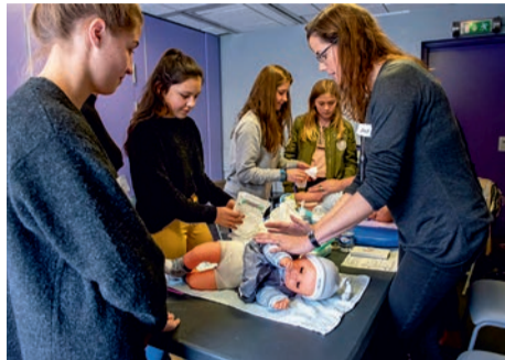
Atelier de baby-sitting.

Scolarité, orientation, formation, job, logement, santé : c'est au Ginkgo qu'il faut s'adresser. Pôle d'activités jeunesse de la Ville et lieu de ressources, le Ginkgo centralise toutes les actions développées par la Ville en direction des 11-25 ans. Dans ses locaux, ouverts toute l'année, le service de la jeunesse propose et organise une offre variée de services : un point information jeunesse (HIJ) permanent, des forums d'orientation et des ateliers de formation (premiers secours PSC1, baby-sitting et Bafa citoyen). L'équipe du service de la jeunesse est spécialisée dans de nombreux domaines (information, prévention, animation, formation, citoyenneté) afin de répondre à toutes les problématiques que les jeunes peuvent rencontrer. Durant les vacances scolaires, il propose aux 11-17 ans une formule d'animations à la carte. Au programme : stages et ateliers thématiques (théâtre, hip-hop,