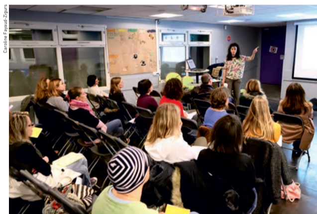
Conférence-débat des « Mercredi des parents ».

Ce cycle trimestriel de conférences-débats animées par des intervenants de qualité (médecins, psychologues, éducateurs spécialisés) aborde de multiples thématiques répondant aux préoccupations des parents : harcèlement scolaire, confiance en soi, conduites à risque... Après chaque