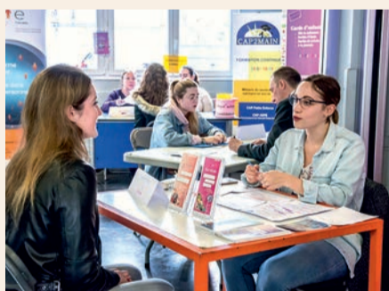
Forum jobs d'été, le rendez-vous du printemps.

Houilles information jeunesse (HIJ), espace local d'information et de documentation pour les 12-25 ans, est accessible librement sans rendez-vous. Sur place, une informatrice jeunesse renseigne et oriente les jeunes Ovillois en fonction de leurs demandes : vie pratique, loisirs, métiers, orientation scolaire et professionnelle, formation, santé, emploi, mobilité internationale et européenne... La structure met à leur disposition une documentation complète sur les études et les métiers, des offres (jobs en France et à l'étranger, alternance, formation,