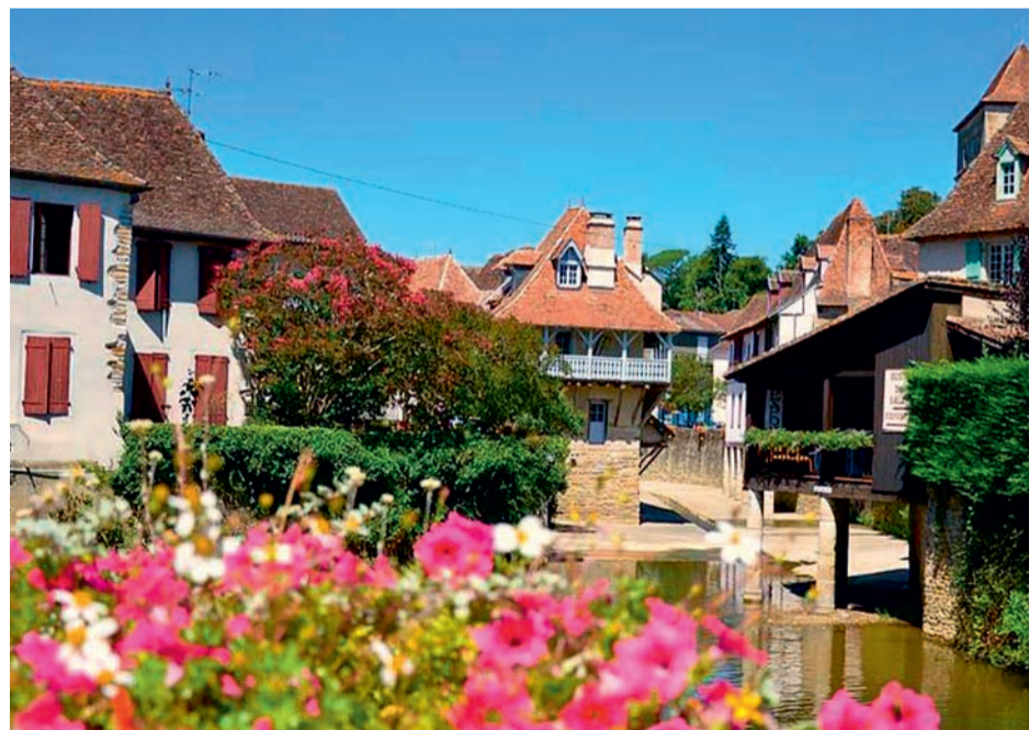
Un séjour à Salies-de-Béarn (Pyrénées-Atlantiques) est proposé aux seniors ovillois.

L e centre communal d'action sociale (CCAS) propose, aux seniors âgés de 60 ans et plus, un séjour à Salies-de-Béarn (Pyrénées-Atlantiques) du 12 au 18 mai. Les Ovillois qui souhaitent y participer sont invités à s'inscrire dès le 18 février au CCAS. Le programme du séjour fait la part belle au dépaysement et à la découverte du patrimoine historique, culturel et naturel du Béarn : Salies-de-Béarn et son musée de sel ; Pau, cité royale où naquit Henri IV ; Jurançon, célèbre commune viticole, ainsi que les villages de Sare et d'Espelette dont