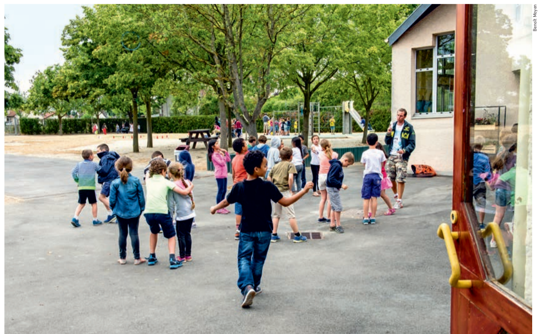
La municipalité, via le service de la jeunesse, développe une offre d'accueil, d'information, d'orientation et d'activités à vocation éducative pour les jeunes de notre commune.

La Ville de Houilles a inscrit l'action en faveur de la jeunesse au cœur de ses priorités. La municipalité développe ainsi une offre d'accueil, d'information, d'orientation et d'activités à vocation éducative pour les jeunes de notre commune. S'appuyant sur les compétences de différents interlocuteurs, des responsables municipaux aux représentants institutionnels ou associatifs ovilleois, le service de la jeunesse de la Ville s'investit de façon permanente dans une dynamique partenariale forte. « L'objectif de la municipalité est de permettre aux jeunes Ovilleois d'être des citoyens autonomes, responsables et épanouis dans notre ville, explique le maire Alexandre Joly. L'engagement des jeunes dans la vie de leur cité est une priorité municipale, car ce sont eux les citoyens d'aujourd'hui et de demain. Il est important que nous valorisions leurs actions et que les initia-