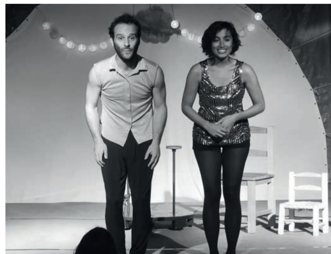
« Le sourire de la note sensible » mêle cirque, théâtre et danse pour une ode à la solidarité.

Samedi 30 mars, à 14h30 (dès 5 ans ; durée : 55 min). Sur inscription. Médiathèque Jules-Verne (7, rue du Capitaine-Guise). Inscriptions au 01 30 86 21 20 / bibliotheque-houilles@ville-houilles.fr