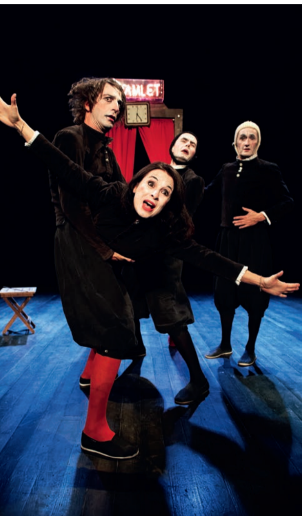
La Cie Bruitquicourt propose une version déjantée de la célèbre tragédie Hamlet de William Shakespeare.