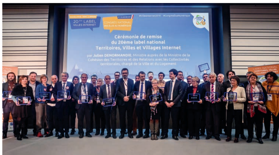
Remise du label national « Ville Internet », le 29 janvier dernier, à la Grande Arche de la Défense.

Quatre arobases pour Houilles ! À l'occasion de la 20 e édition du label national « Ville Internet », qui s'est déroulée à Paris le 29 janvier dernier, la Ville de Houilles s'est vu décerner une quatrième arobase sur une échelle de cinq, pour l'ensemble des actions menées par la collectivité en faveur d'un Internet local citoyen.