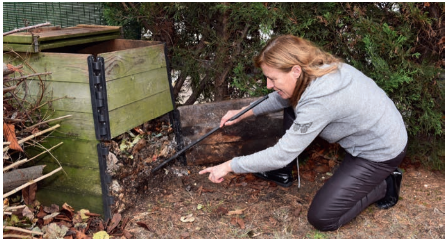
Le compostage permet de réduire d'un tiers nos déchets ménagers.

La communauté d'agglomération Saint-Germain-Bocles-de-Seine (CASGBS) reconduit en mars sa campagne de promotion du compostage domestique. Au programme : distribution de composteurs à prix préférentiels (au choix trois modèles en bois entre 20 et 30€) avec une initiation gratuite pour acquérir les bonnes pratiques du compostage. Pour bénéficier de cette offre, il convient de s'inscrire avant le 11 mars sur le site Internet de la CASGBS. À Houilles, où le tissu pavillonnaire est important, le compostage fait de nombreux adeptes. Une pratique écologique simple qui, en plus de transformer tontes de gazon, tailles, fleurs fanées et épluchures de fruits et de légumes en engrais naturel, permet de réduire nos déchets ménagers d'un tiers. Pratiqué par