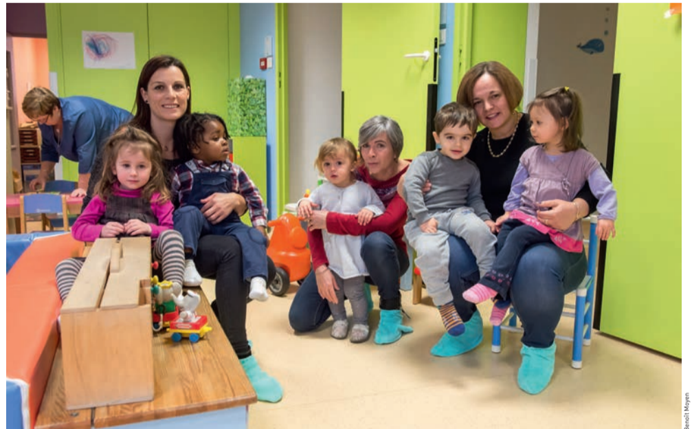
La Ville gère cinq crèches collectives, une crèche familiale et un multi-accueil avec une capacité totale de près de 270 berceaux.

T rouver un mode de garde pour son enfant est une préoccupation que partagent tous les jeunes parents. Certains d'entre eux, attirés par un accueil plus personnalisé, préfèrent des modes de garde individuels en faisant appel à une assistante maternelle indépendante ou à une auxiliaire parentale. D'autres privilégient les modes de garde collectifs, qui permettent aux tout-petits d'apprendre à vivre en groupe dans des crèches parentales, associatives ou municipales.