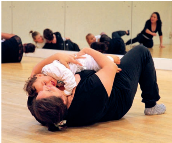
La « Matinée dansée » permet de petits jeux corporels simples entre parents et enfants.

« Do it yourself ». Cet atelier, qui s'adresse aux adultes, vous initie à l'art de l'himmeli. À l'origine, il s'agissait d'une suspension décorative de Noël traditionnelle en paille issue des pays nordiques. Un montage simple, dans lequel un seul fil relie tous les morceaux par des nœuds invisibles. Aujourd'hui, c'est devenu un mobile géométrique très tendance, dont les designers et créateurs en ont fait un objet de déco incontournable.