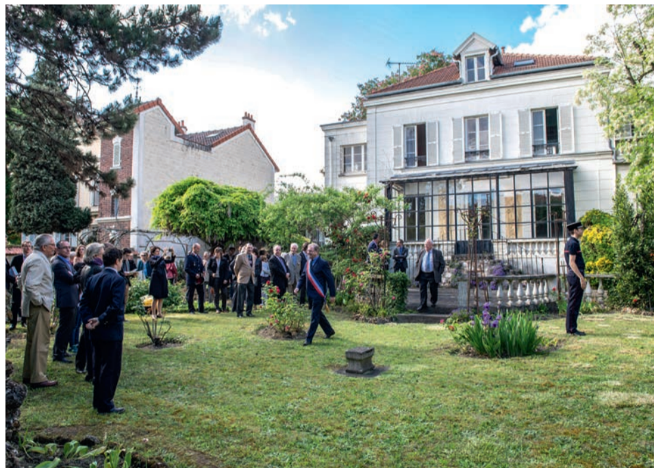
Le projet de la maison Schœlcher pourrait s'inscrire dans le cadre des missions de la future Fondation nationale pour la mémoire de l'esclavage.

L a Ville de Houilles va adhérer, comme membre fondateur, à la future Fondation nationale pour la mémoire de l'esclavage. Une décision légitime pour la commune où, durant dix-huit ans, vécut Victor Schœlcher (1804-1893), auteur du décret d'abolition de 1848.