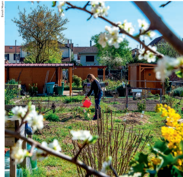
Les jardins familiaux, qui abritent 22 parcelles, sont le terrain d'expériences collectives et de moments de partage.