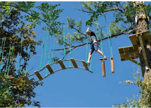
Les séjours d'été proposés par la Ville conjuguent découverte, divertissement et loisirs (ci-dessus : Accrobranche).

Chaque été, la Ville propose des séjours en juillet et en août pour les jeunes Ovillois âgés de 7 à 16 ans. Ils bénéficient d'un programme d'animations variées, qui conjugue découverte, divertissement et loisirs. Au programme :