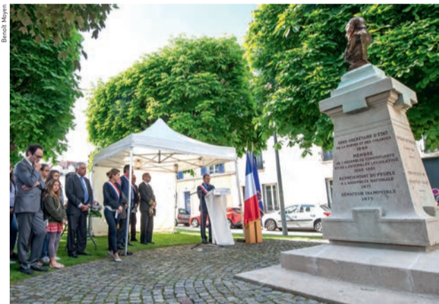
Cérémonie départementale : vendredi 10 mai, à 10 h 45, place Victor-Schœlcher.

universel ou encore de l'école laïque a marqué l'histoire de la République. ■