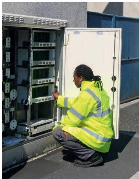
Le déploiement de la fibre optique couvre aujourd'hui 89% du territoire de la commune.

A Houilles, aujourd'hui, 15 032 logements (9 157 logements collectifs et 7 774 habitations individuelles) sont éligibles à la fibre optique. Un taux de couverture représentant 89% du territoire de la commune, et qui devrait atteindre 97% fin 2019. Actuellement, l'opérateur Orange poursuit le développement du réseau dans les quartiers des Pierrats et du Tonkin. Des