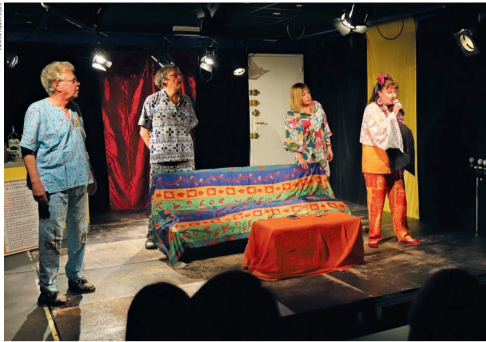
Représentation de la comédie musicale « T'as le ticket Toc » par la C ie La Bohème, au Triplex.