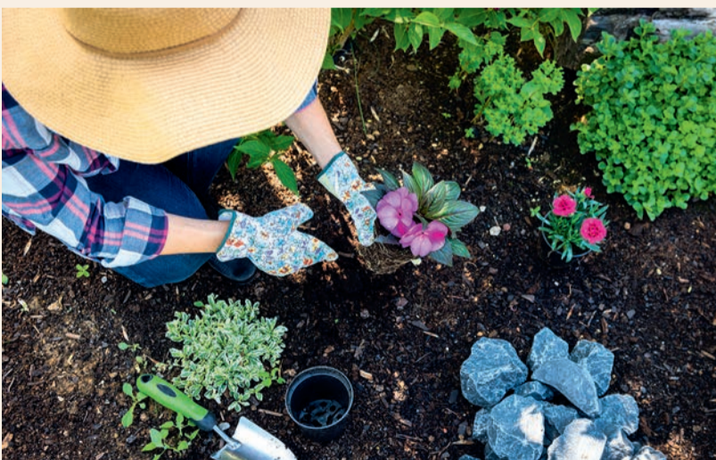
Depuis le 1 er janvier 2019, les particuliers ne peuvent plus utiliser de pesticides chimiques pour jardiner ou désherber.

La réglementation concernant l'utilisation des pesticides chimiques 1 évolue, afin de protéger votre santé et l'environnement. Depuis le 1 er janvier 2019, les particuliers ne peuvent plus