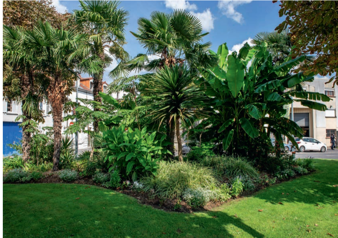
Houilles s'inscrit dans des perspectives d'avenir en s'appuyant sur une gestion durable de son territoire à travers la préservation de ses jardins, parcs, squares et espaces verts.

Le service de l'environnement et des espaces verts œuvre au fil des saisons à rendre la commune agréable pour ses habitants, en fleurissant continuellement jardins, parcs, squares et places. Tous ses efforts en faveur des espaces verts, de la faune et de la flore ont un seul but : préserver la qualité du cadre de vie urbain.