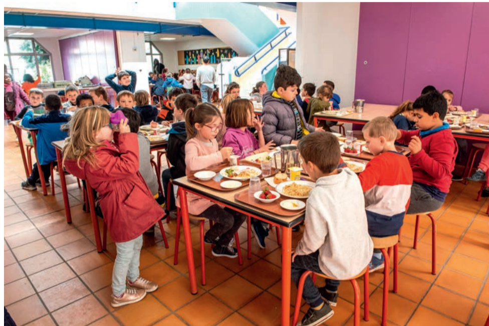
Dès la mi-mai, les écoliers demi-pensionnaires vont trier leurs déchets alimentaires.