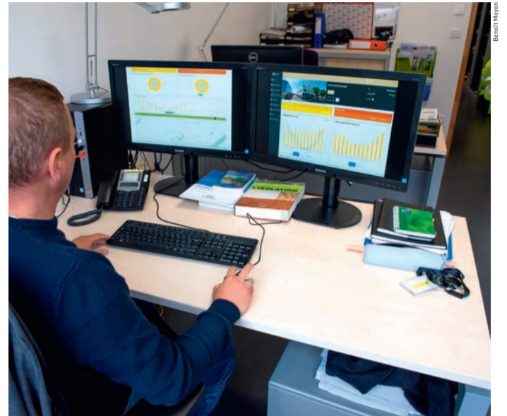
Le Ville a mis en place de nouveaux outils de diagnostic énergétique et de gestion de consommation des flux des bâtiments municipaux.