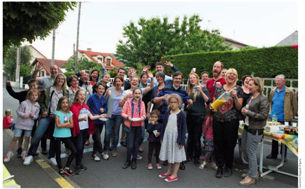
La Fête des voisins : convivialité, rencontres et échanges de proximité avec ses voisins.

Vendredi 24 mai, à partir de 19 h. Renseignements au 01 30 86 37 29 et sur fetedesvoisins@ville-houilles.fr