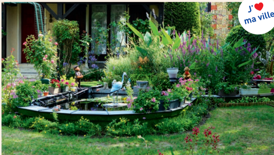
Le concours « Maisons et balcons fleuris » récompense les actions de fleurissement menées par les Ovillois.

Vous aimez fleurir votre jardin : un peu, beaucoup, passionnément, à la folie ? Le concours municipal « Maisons et balcons fleuris » 2019 vous donne l'occasion de montrer tout votre savoir-faire ! Ce concours municipal annuel, ouvert à tous, récompense les actions de fleurissement menées par les habitants, et contribue, le temps d'un été, à l'embellissement de la commune. Coin de jardin, balcon, jardin potager, ou rebord de fenêtre, le moindre endroit peut être exploité. Seul impératif : les fleurissements doivent être visibles de la rue. Pour y participer, il suffit de remplir