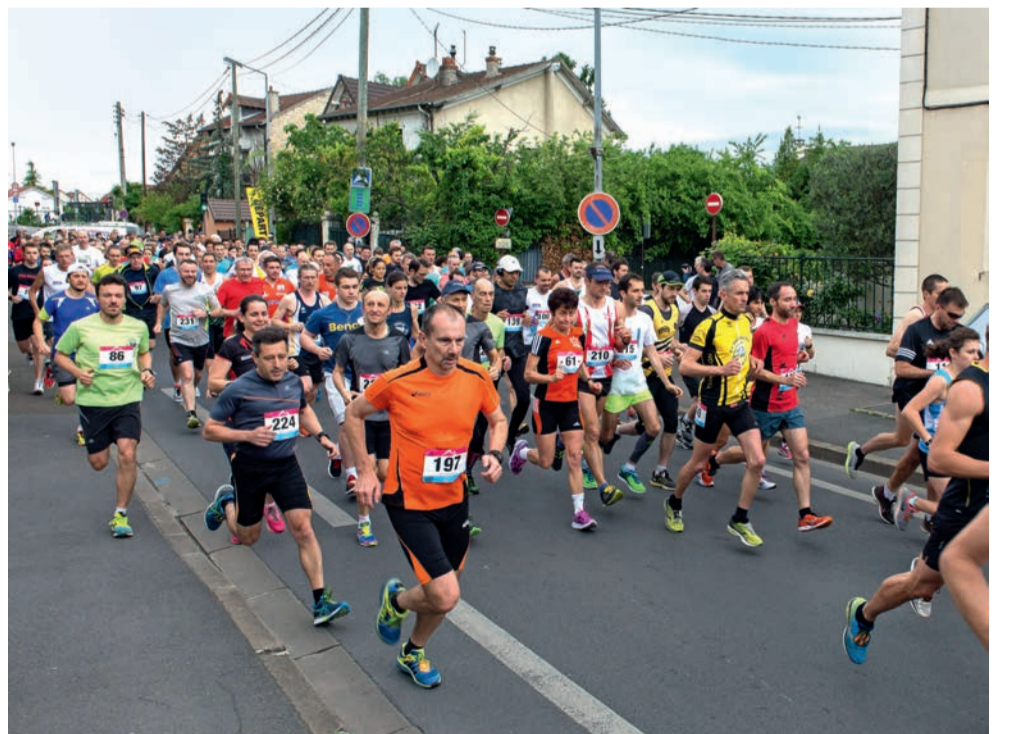
Le Tour de Houilles, épreuve qualificative pour le championnat de France, emmène les coureurs pour un parcours de 10 km dans les rues de la ville.

Dimanche 12 mai. Départ à 9 h 30 (64, rue de la Marne). Inscriptions : sohathle.free.fr ou protiming.fr