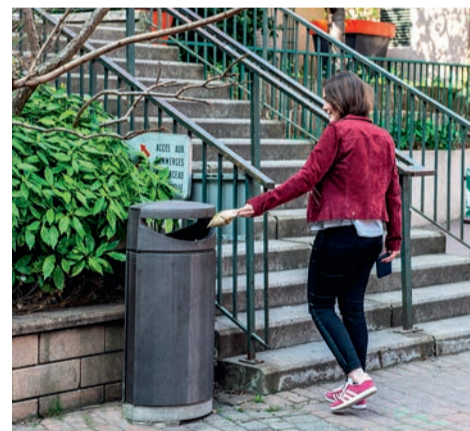
La propreté des rues est à portée de main!