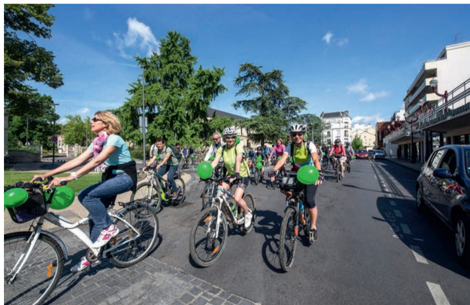
Houilles est une des villes étapes de la Convergence francilienne qui invitent les cyclistes à se rassembler pour rejoindre à vélo le cœur de Paris.

À l'occasion de la Fête nationale du vélo, l'association Mieux se déplacer à bicyclette en Île-de-France (MDB-IDF) organise, le 2 juin, la 12 e édition de la Convergence francilienne. Familiale, gratuite et festive, cette manifestation réunit, depuis 2008, des milliers d'amoureux de la petite reine, au départ d'une centaine de villes étapes d'Île-de-France, qui convergeront ensuite vers Paris. Les cyclistes ovilleois qui souhaitent participer à cette manifestation sont invités à se rendre devant l'hôtel de ville pour rejoindre