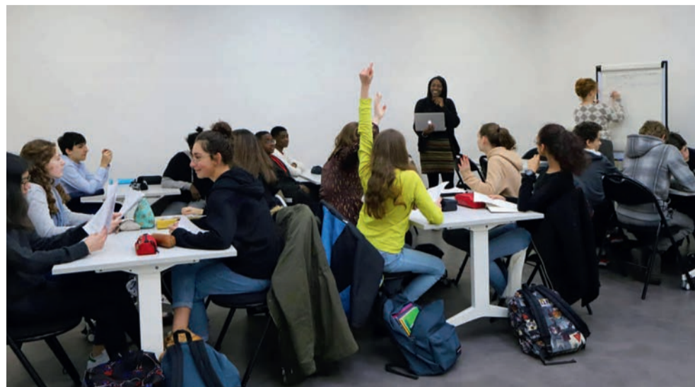
Des élèves du collège Maupassant et des écoles Buisson et Détraves ont été initiés aux techniques de narration théâtrale à travers des ateliers d'écriture de la médiathèque.