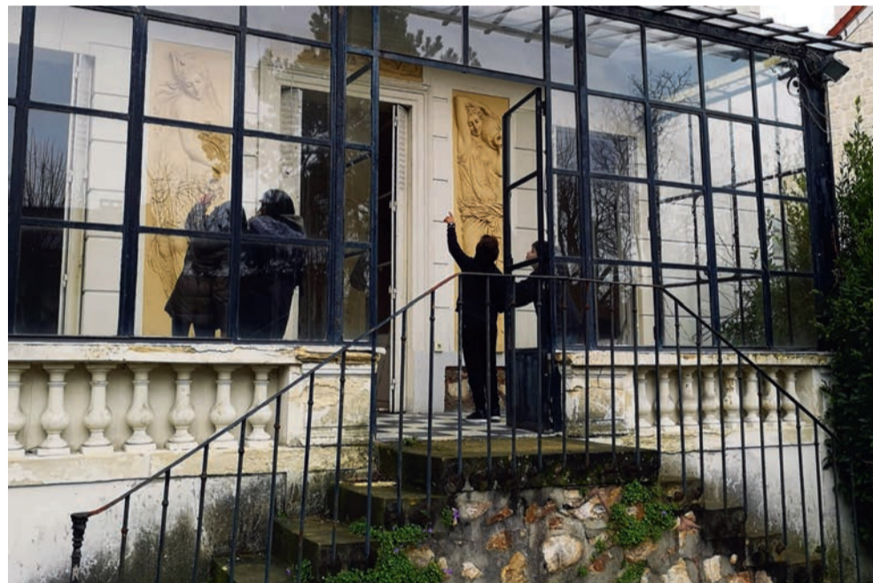
Les enfants d'une classe de CM2 ont visité la maison Schœlcher dans le cadre d'un projet pédagogique autour de l'esclavage et de la vie de Victor Schœlcher.