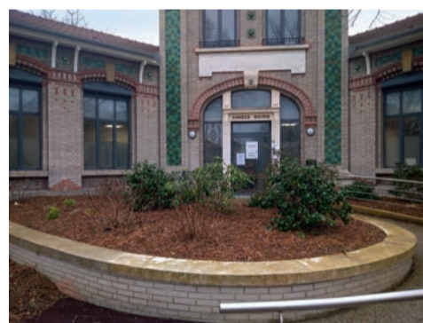
Le broyat obtenu à partir des sapins de Noël permet de conserver l'humidité du sol et de protéger les végétaux du froid.

La collecte sélective des déchets dans les cours des écoles sera également mise en place grâce à l'installation de corbeilles à doubles fûts ; un pour la collecte des déchets recyclables et l'autre pour les déchets résiduels non recyclables. ■