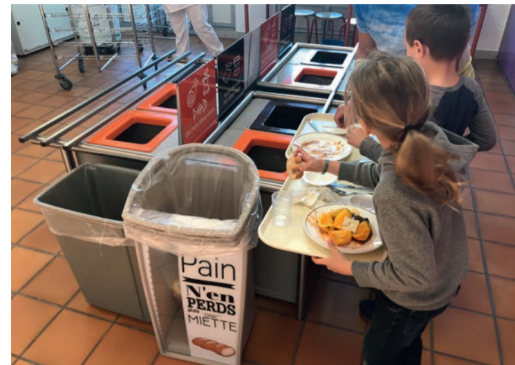
Récupérés deux fois par semaine dans 11 points de collecte, les biodéchets des écoles ovilleoises sont valorisés en compost et biogaz.

Tous ces projets ont été mis en œuvre par la commission des menus de la Ville et en partenariat avec les écoles et les fédérations de parents d'élèves. ■