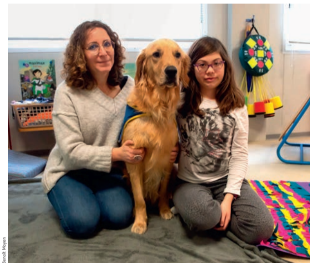
Le chien d'éveil Nevez, qui intervient dans l'école Paul-Bréjeat, aide les enfants à faire face à leurs défis quotidiens.

Ce projet, porté par le Siam78 (Service d'intégration pour aveugles et malvoyants), qui accompagne des enfants et des adolescents dans l'acquisition de leur autonomie, s'intègre pleinement dans le projet éducatif de territoire (PEDT) de la Ville soutenant les actions en faveur de l'inclusion, de la lutte contre les discriminations et du respect de la différence. « L'estime de soi, l'aide au lan-