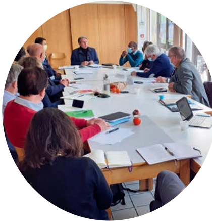
Présentation du cabinet Anfore, spécialisé dans le recrutement, aux membres de CQFD Cadre 78.

Tél. : 06 17 43 34 80 contact@cqfd-cadres78.fr