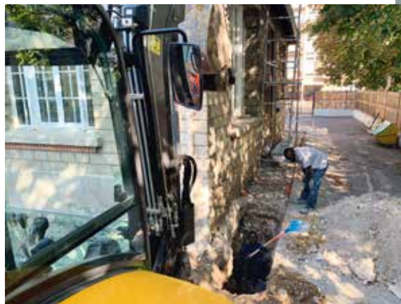
— École Toussaint-Guesde.

Les travaux dans les écoles ont aussi pour but d'améliorer les conditions d'enseignement. Pour ce faire, la Ville adapte progressivement ses équipements à la transformation numérique des établissements en développant les ressources digitales pédagogiques nécessaires. Condition indispensable de cette adaptation ? L'installation de la fibre et du WiFi dans toutes les écoles comme c'est désormais le cas après le raccordement cet été des