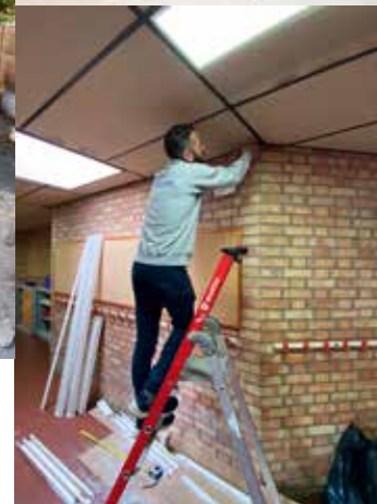
— École Schœlcher.