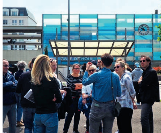
Une balade urbaine en mai 2023 dans le cadre de la concertation.